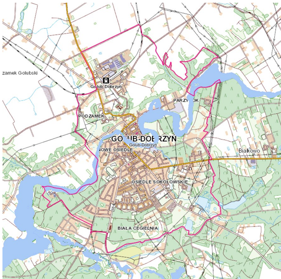
Ryc. 1. Golub-Dobrzyń na mapie topograficznej

Przez Golub-Dobrzyń nie prowadzą żadne drogi krajowe. Podstawową obsługę zewnętrzną miasta zapewniają trzy drogi wojewódzkie nr 534 Lipnica – Golub-Dobrzyń – Rypin, 554 Kowalewo Pomorskie - droga krajowa nr 10 – Zbójno – Kikół i 569 Golub-Dobrzyń – Dobrzejewice - droga krajowa nr 10. Miasto stanowi więc węzeł komunikacyjny, jeden z większych we wschodniej części województwa kujawsko-pomorskiego. Uzupełnienie układu drogowego stanowią drogi powiatowe. Zapewniają połączenia drogowe miasta z jednostkami osadniczymi w otoczeniu. Przez obszar miasta nie prowadzi żadna czynna linia kolejowa.