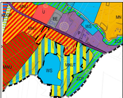
WYRYS ZE STUDIUM UWARUNKOWAŃ I KIERUNKÓW ZAGOSPODAROWANIA PRZESTRZENNEGO MIASTA GOLUB-DOBRYŃ

GRANICA OBSZARU OBJETEGO PLANEM MIEJSCOWYM