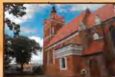
Gotycki kościół parafialny p.w. św. Katarzyny w Golubiu