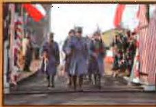
Most im. „Błękitnej Armii” gen. J. Hallera