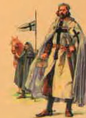
Rycerze Zakonu Krzyżackiego

Jedna z legend opowiada o zaklętych schodach, znajdujących się w Zamku Golubskim. W wielu zamkach średniowiecznych panował zwyczaj, że do komnat mieszkalnych, mieszczących się na piętrach, wjeżdżano na koniach. Dopiero tam z nich schodzono i służba odprowadzała konie do stajni. Rycerze wjeżdżali konno na piętro nie z powodu lenistwa, tylko ze względu na ciężkie zbroje, w jakie byli ubrani. Schody w Zamku Golubskim są niezwykle i zaczarowane, bo kto nimi raz przejdzie, to w ciągu najbliższego roku, w chwili dla siebie poważnej, może zarzec jak koń. Jak głosi współczesna legenda, różne już były z tego powodu śmieszności i nieporozumienia. To oczywiście tylko legenda i wierzyć w nią trzeba, choć ponoć prawdą to jest, co opowiada.