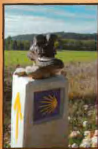
Znak szlaku św. Jakuba

Szlak św. Jakuba (hiszp. Camino de Santiago) to trasa pielgrzymkowa, która ma ponad 3000 lat tradycji. Wiedzie do grobu św. Jakuba Apostoła w Santiago de Compostela w północno-zachodniej Hiszpanii. W województwie kujawsko-pomorskim wzór znaku to żółta muszla morska umieszczona na niebieskim tle. Polska droga szlaku św. Jakuba prowadzi przez powiat golubsko-dobrzyński. W miejscowości Płonno, znajduje się kościół parafialny pod wezwaniem św. Jakuba, obok którego w średniowieczu najprawdopodobniej przebiegał szlak pielgrzymkowy. Od 2009 roku organizowana jest piesza pielgrzymka z kościoła parafialnego pw. św. Jakuba w Płonnem do Ośrodka Chopinowskiego w Szafarni.