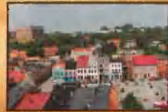
Widok na Rynek w Golubiu