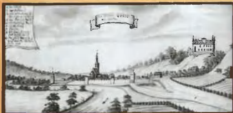
Widok Golubia i zamku z XVIII w.

Początkowo Golub i Dobrzyń, terytorialnie należały do dwóch różnych ziem, a administracyjnie do różnych województw i powiatów.