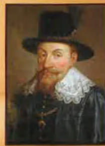
Król Zygmunt III Waza (1566-1632)

Bardzo pomyślny dla Golubia był okres, w którym król Zygmunt III Waza nadał starostwo golubskie (1611-1625) swojej siostrze Annie Wazównie. Zamieszkiwała ona na golubskim zamku. Sam król ufundował natomiast dzwon do kościoła w Golubiu, który już od 400 lat bije w naszym mieście.