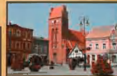
Dawny Zbór Ewangelicki