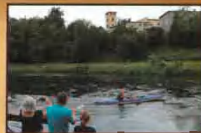
Spywy kajakowe rzeką Drwęcą