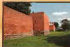
Fragmety murów obronnych