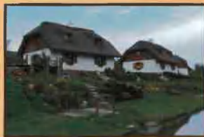
Osada Karbówko w Elgiszewie