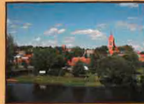
Rzeka Drwęca - widok na przystań przy ulicy Zamurnej

Niezwykle interesujący pod względem przyrodniczym jest obszar doliny Drwęcy, stanowiący ichtiologiczny rezerwat przyrody. Utworzony on został w 1961 r. jako wodny rezerwat przyrody pod nazwą „Rzeka Drwęca”, głównie dla ochrony tarlisk ryb łososiowatych. Na zboczach doliny znajduje się rezerwat przyrody Bobrowisko. Spotkać tu można wiele rzadkich, chronionych gatunków roślin i zwierząt. W regionie jest ponad 50 pomników przyrody.