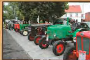
Wystawę ciągników Stowarzyszenia Retro Traktor