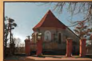
Kościół w Płonnem