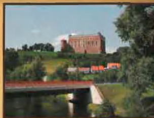
Rzeka Drwęca z widokiem na zamek

Miasto Golub-Dobrzyń położone jest w województwie kujawsko-pomorskim, około 40 km od Torunia. To jeden z ważniejszych ośrodków na ziemi chełmińskiej. Jego niewątpliwym atutem jest malowniczy krajobraz. Przez Golub-Dobrzyń przepływa rzeka Drwęca - największy prawy dopływ dolnej Wisły. Drwęca dzieli miasto na dwie części - na lewobrzeżny Dobrzyń i prawobrzeżny Golub. Od 1999 roku miasto jest siedzibą władz powiatowych. Obecnie Golub-Dobrzyń liczy około 12 tysięcy mieszkańców.