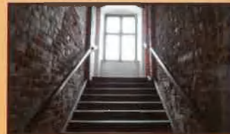
Schody Zamku Golubskiego