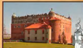
Zamek Golubski i Rycerz z XIII w.