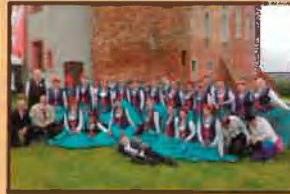
Przegląd zespołów ludowych