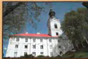
Zespół Klasztorny Karmelitów w Oborach