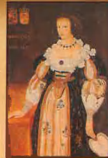
Anna Wazówna (1568-1625)

otrzymała Anna Wazówna, siostra króla Polski Zygmunta III Wazy. Królowna Anna na terenach przyległych do zamku założyła piękne ogrody, w których prawdopodobnie po raz pierwszy w Polsce wyhodowała tytoń. Zamek golubski od lat siedemdziesiątych jest organizatorem ciekawych imprez historyczno-kulturalnych. Obecnie mieści się tu także hotel i restauracja.