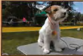
Wystawa psów rasowych