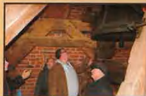
Zwiedzanie wieży kościelnej