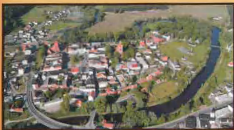
Golub-Dobrzyń z rzeką Drwęcą (widok z lotu ptaka)

Rzeka Drwęca stanowiła nawet linię graniczną między dwoma państwami - najpierw między Polską, a państwem zakonu krzyżackiego, a w latach 1775-1806 i 1815-1920 była to granica pomiędzy zaborem pruskim i rosyjskim. W każdym z nich odmiennie wyglądało życie, co wpłynęło na ostateczny kształt obu miast.