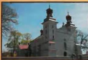
Kościół parafii pw. Świętej Trójcy w Działyniu