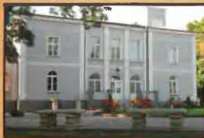
Ośrodek Chopinowski w Szafarni