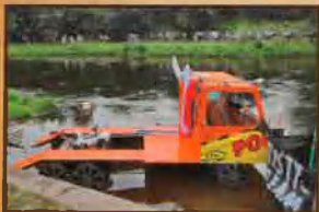
Spyw na byle czym