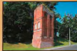
Ruiny zamku w Kowalewie Pom.

Ponadto warto zobaczyć: Regionalną Izbę Pamięci M. Dąbrowskiej w Płonnem, Kościół drewniany pw. Narodzenia Najświętszej Marii Panny w Dulsku, Szlak św. Jakuba, Szlak Fryderyka Chopina, Rezerwat przyrody Bobrowiska, Górę Modrzewiową