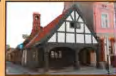
Domek z Podcieniami